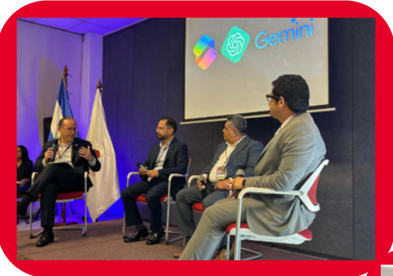
I Foro Ejecutivo: “IA y el Nuevo Marco Empresarial”

ISEADE, imparte conferencias y foros con el apoyo de sus catedráticos nacionales e internacionales. Las conferencias son gratuitas y están abiertas a diversos públicos, según la temática a desarrollar. Este año se impartieron las siguientes: